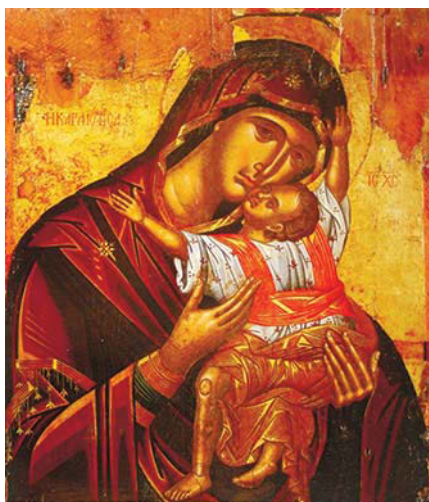
Икона Божией Матери «Кардиотисса» («Богородица Сердечная»)

Когда в жизни – по-настоящему сложные моменты – люди всегда нуждаются в вере.