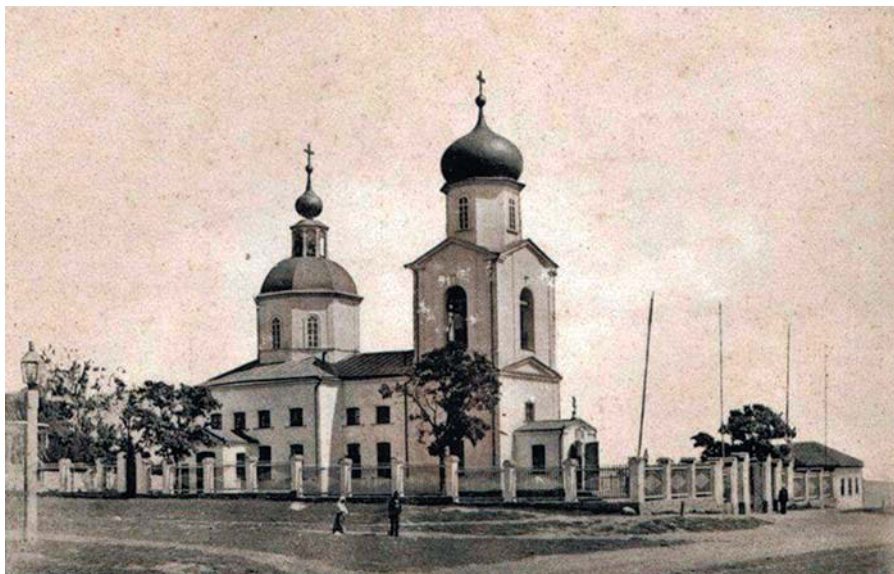
Таганрог. Церковь Святой Троицы. Конец XIX – начало XX вв.

Вскорости старчество выходит и за монастырские стены, потому что у православного народа возникает в нем потребность, так как миряне, не находя удовлетворение в приходской жизни, пришедшей в упадок в синодальный период, начинают идти к духовным наставникам, стремясь найти и находя у них то, что раньше они могли получить в полноценной приходской жизни, в общении со своим приходским священником. Поиск духоносных наставников — это реакция мирян на кризис синодальной системы, который поразил основной элемент церковного организма – приход. Вся строгость духовной цензуры была направлена против любого проявления живой богословской мысли, с опаской и недоверием относясь к аскетическому мистицизму, к творениям святых отцов Макария Великого и Исаака Сирина. По словам издателя русского литературного журнала «Маяк», выходявшего в сороковых годах XIX века, С.А. Бурачка, «по академиям и семинариям все наши отцы-подвижники обречены в лжемистики и мечтатели, и умная, сердечная молитва уничтожена и осмеяна как зараза и пагуба. В семинариях и академиях не только ей не учат, но еще сызмала предостерегают и отвращают». 6