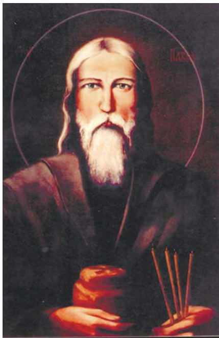
Образ святого праведного Павла Таганрогского.

Так было и в общине старца Павла: многие жертвовали старцу от своих трудов на добрые дела, он же эти средства употреблял на благоустройство храмов и вспомоществование нуждающимся, и это делание сохранялось в общине и после его смерти.